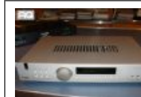
Amplificatori Integrati Arcam FMJ A18 € 500,00